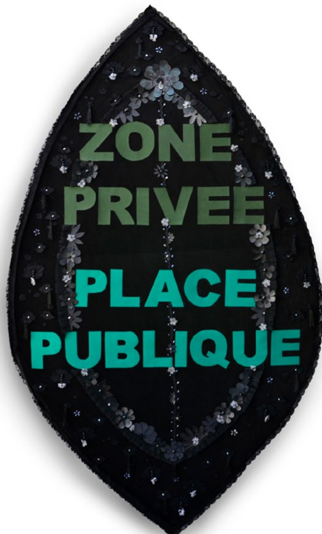
F&G, ZAD - Zone À Débat, 2022