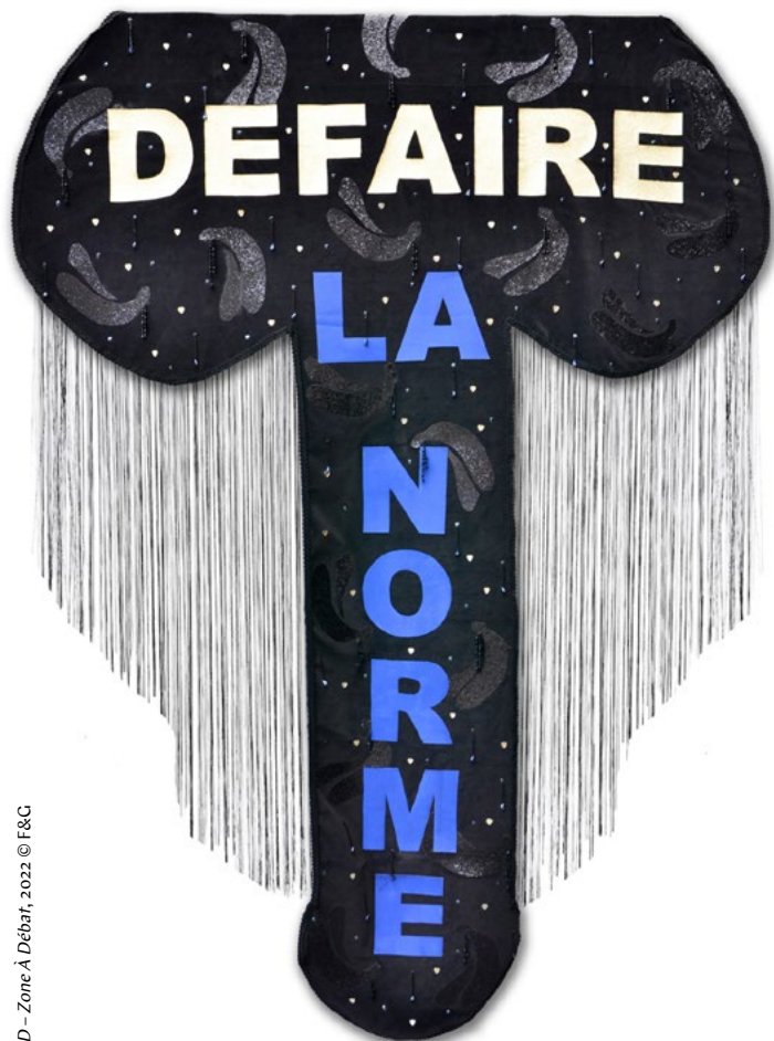
F&G, ZAD - Zone À Débat, 2022 © F&G