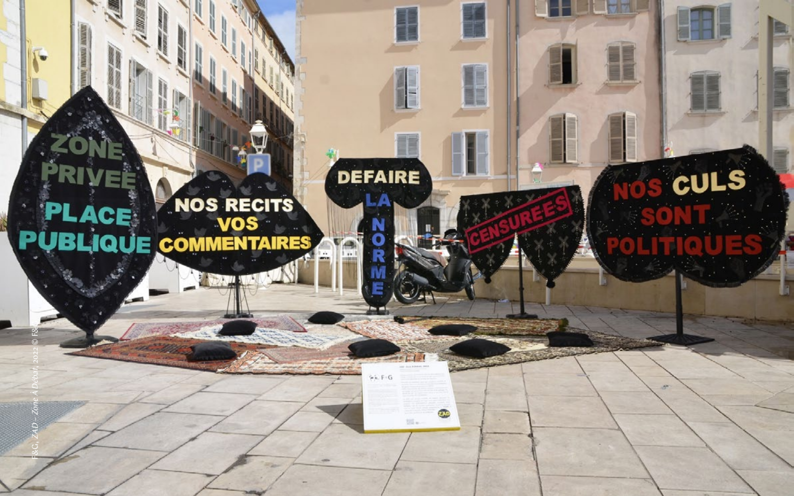
F&G, ZAD - Zone À Débat, 2022 © F&G